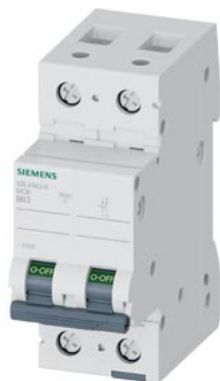
wyłącznik nadmiarowo-prądowy 230 V 10 kA, 1+N-bieg., B, 63 A