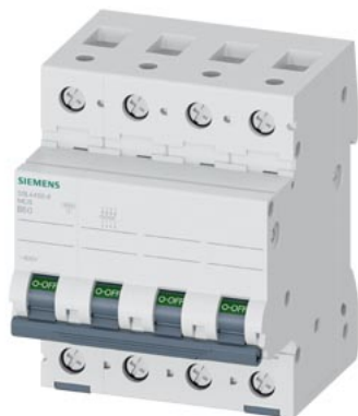
wyłącznik nadmiarowo-prądowy 400 V 10 kA, 4-bieg., B, 50 A