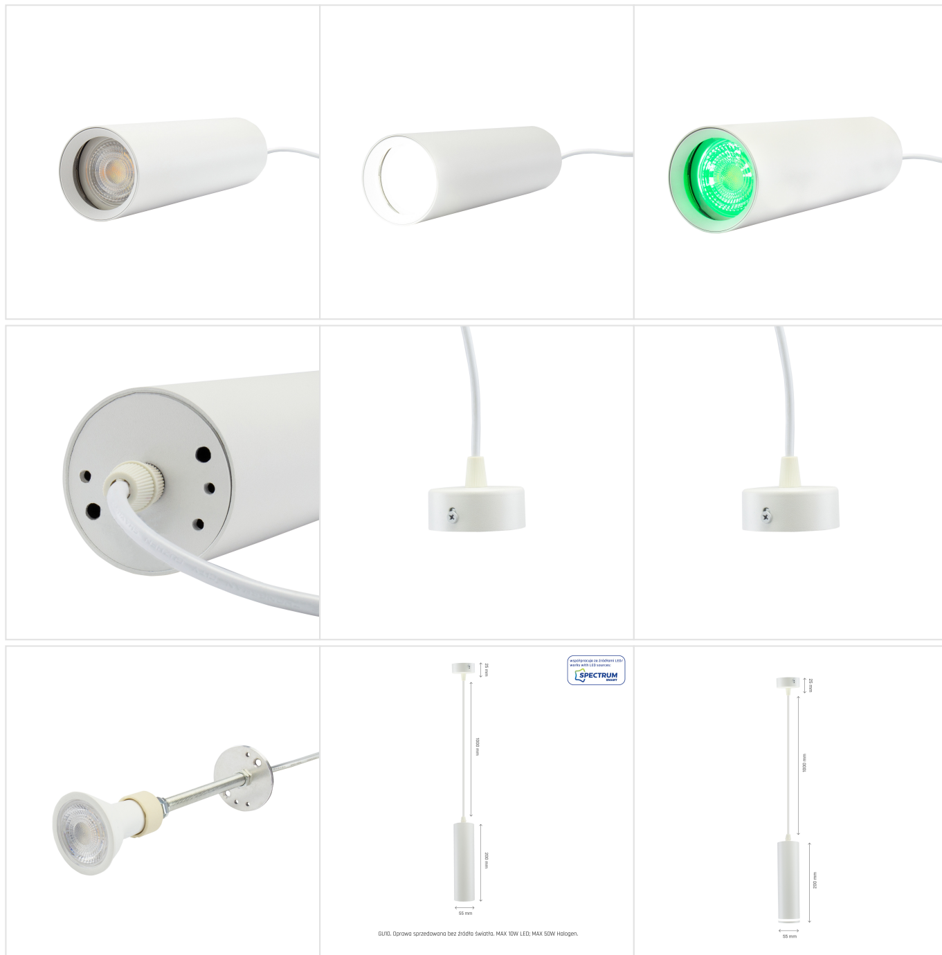
GU10, Oprawa sprzedawana bez źródła światła, MAX 10W LED; MAX 50W Halogen.