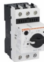
Wyłącznik silnikowy SM1R