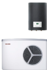
HPA-O Premium Flex Set