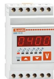
Urządzenia pomiarowe – Woltomierz DMK70R1 3