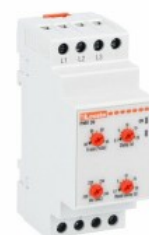
Przełączniki nadzorcze napięcia PMV30