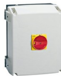
Puste obudowy, z tworzywa sztucznego GAZ