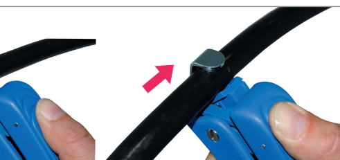
Zdejmowanie izolacji zewnętrznej