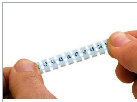
Odcinki paska oznaczników