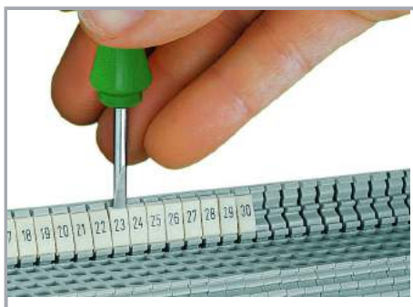
Montaż zatraskowy paska oznaczników w miejscu na oznacznik w podwójnej podstawie oznacznika