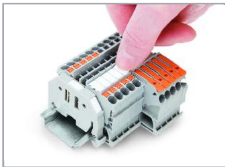
Montaż zatraskowy paska oznaczników w miejscu na oznacznik