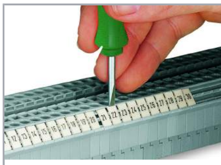
Montaż zatraskowy paska oznaczników w miejscu na oznacznik