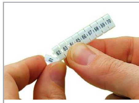
Oddzielanie pojedynczej tabliczki, do złączki o większej szerokości

Dokonywanie zmian zastrzeżone. Należy stosować się do dokumentacji technicznej produktów.